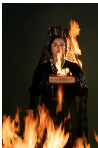
Pilar Albarracín (Séville, 1968) No apagues mi fuego, déjame arder II 2020 Photographie couleur 187 x 125 cm.