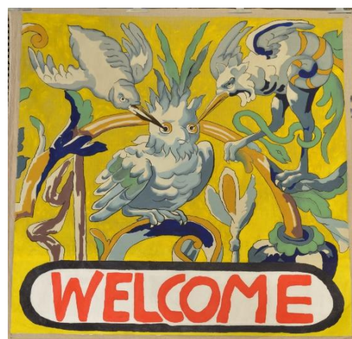
Pilar Albarracín (Séville, 1968) Welcome I 2024 Acrylique et fusain sur toile 214 x 221 cm