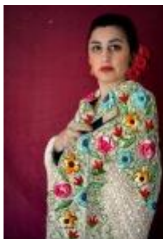
Pilar Albarracín (Séville, 1968) Mantón 2009 Photographie et broderie 22 x 15 cm