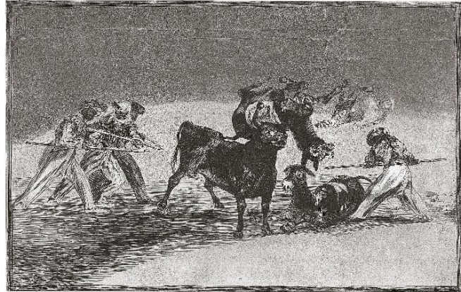
Francisco Goya (1746-1828) Série La Tauromachie (1815-1816) Jusqu'à son grand-père Planche 17 Eau-forte, aquatinte brunie, pointe sèche et burin 248 x 356 mm Collection Musée Goya – Castres