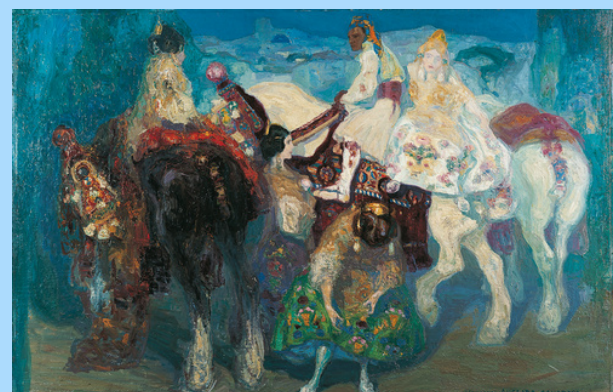
Hermen Anglada Camarasa, Noce à Valence , 1906, huile sur bois, 0,816 x 1,202, dépôt du Musée National d'art moderne de Paris

Informations pratiques : Musée Goya de Castres Rue de l'Hôtel de Ville BP 10406 - 81108 CASTRES Cedex www.museegoya.fr 05 63 71 59 30 - goya@ville-castres.fr