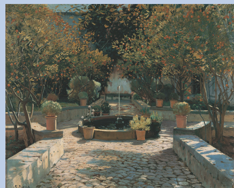
Santiago Rusiñol y Prats (1861-1931), La Cour des orangers. Huile sur toile, 1904. Dépôt de l'Etat