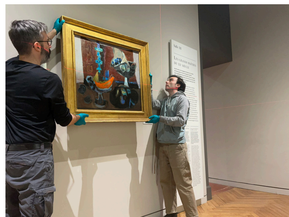
Antoni Clavé (1913-2005), Nature morte Huile sur toile, 1946. Dépôt du Musée d'Art Moderne de Paris

Parmi les couleurs relativement sombres utilisées pour dessiner l'espace autour d'une corbeille de fruits, deux couleurs plus claires transparaissent. Le bleu clair donne toute son intensité à la couleur complémentaire ajoutée : le orange.