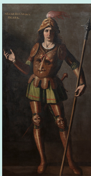
Francisco de Zurbarán (1598-1664) Portrait d'Alvar Belázquez de Lara, vers 1650 Huile sur toile, h : 1,99 m ; l : 1,04 m Dépôt du musée du Louvre, 1959

Dans le cadre de l'exceptionnelle exposition consacrée à Zurbarán qui se tiendra au musée du Louvre du 7 octobre 2026 au 25 janvier 2027, le musée Goya prête le Portrait d'Alvar Belázquez de Lara. Cette huile sur toile peinte vers 1650 illustre l'un des protagonistes de la fameuse et sanglante légende de Lara du haut Moyen Âge. Contemporain de Murillo et de Velázquez, Zurbarán se distingue par la sobriété de ses compositions et l'utilisation du clair-obscur qui donne à ses personnages immobiles et méditatifs un aspect monumental. À partir du 19 juin et ce jusqu'au 15 février, et dans le cadre de la convention qui lie le musée Goya au musée du Louvre, le musée aura la chance de