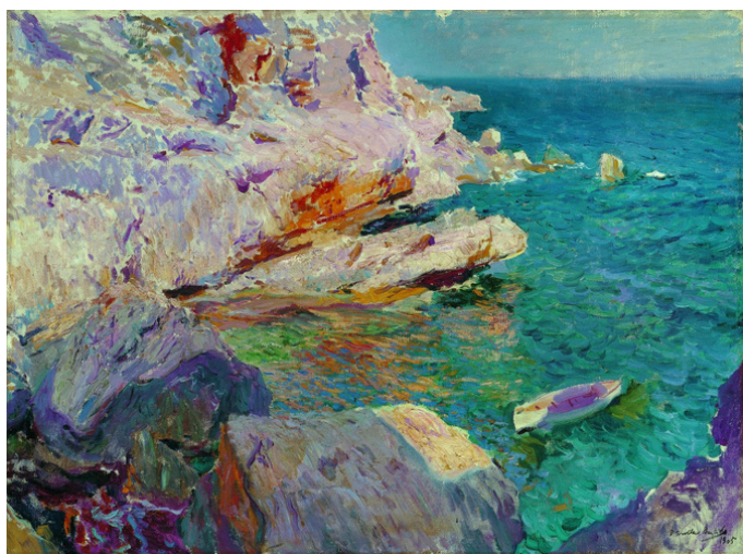
Joaquín Sorolla (1863-1923)

Elle est organisée avec la généreuse collaboration du musée d'Orsay de Paris, du musée des Beaux-Arts de Pau, du musée du Prado de Madrid, du musée Reina-Sophia de Madrid, du musée Carmen-Thyssen de Malaga, du musée des Beaux-Arts de Valence (Espagne), du musée des Beaux-Arts de Bilbao et du musée de Montserrat.