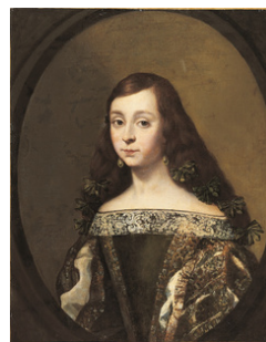
Claudio Coello (1642-1693) Portrait de jeune madrilène huile sur toile, 2 e moitié du XVII e siècle. Collection Musée Goya