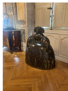
Manolo Valdés (1942-) Menine 2005 Bronze, 123 x 102 x 67 cm FNAC 06-750