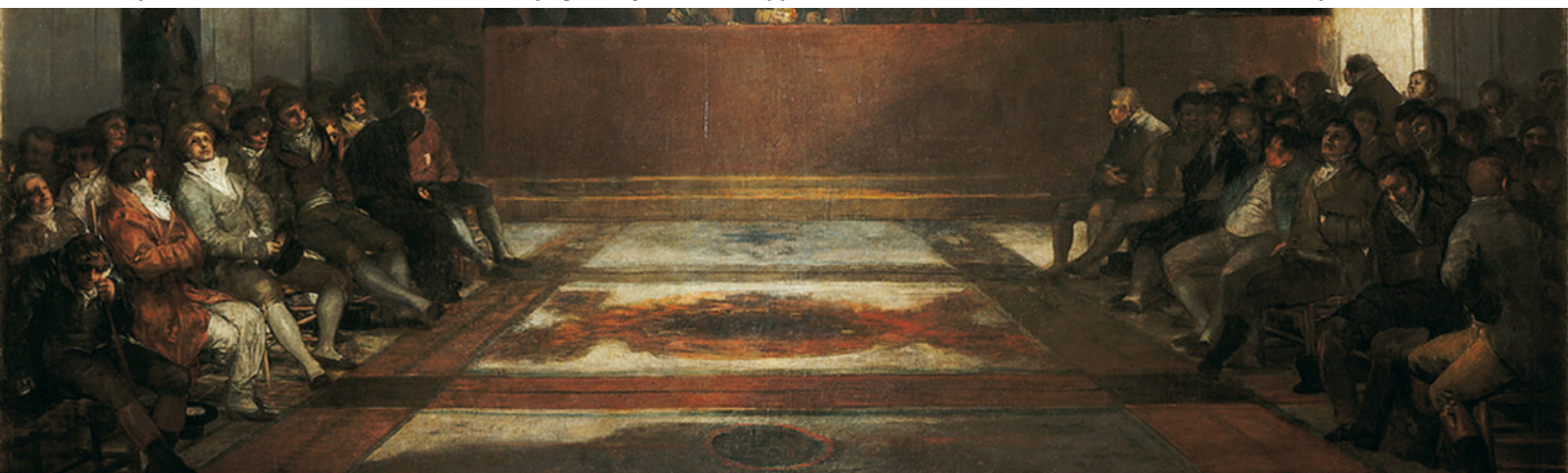
Francisco Goya (1746-1828), L'Assemblée de la compagnie royale des Philippines , 1815, huile sur toile, détail, collection Musée Goya

Histoire culturelle, transversalité des genres artistiques.